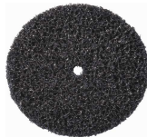
PW2000 Lepezasti brusni kolut za čišćenje