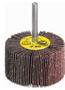
KM613 Mali lepezasti brus za mstal, drvo, plastiku