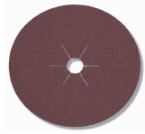
CS561 Brusni fiber disk za metal, drvo, ob.metali