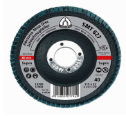
SMT627 Lamelasti brusni disk drvo, čelik, ob.metali